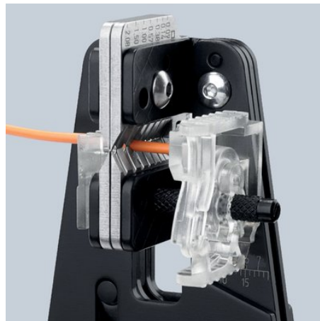
Sauberes Einschneiden der Isolation auf dem gesamten Umfang

Technische Änderungen und Irrtümer vorbehalten