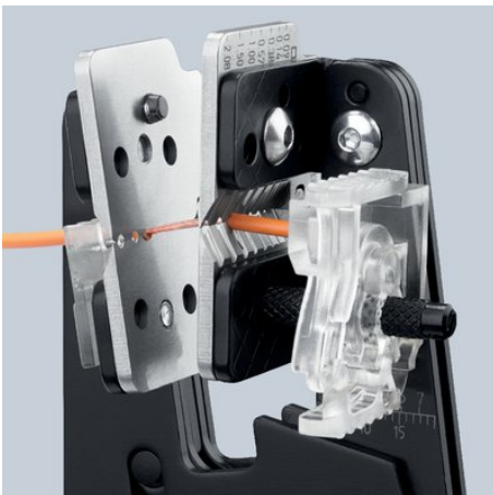
Formschlüssiges Abisolieren durch präzise Messerprofile